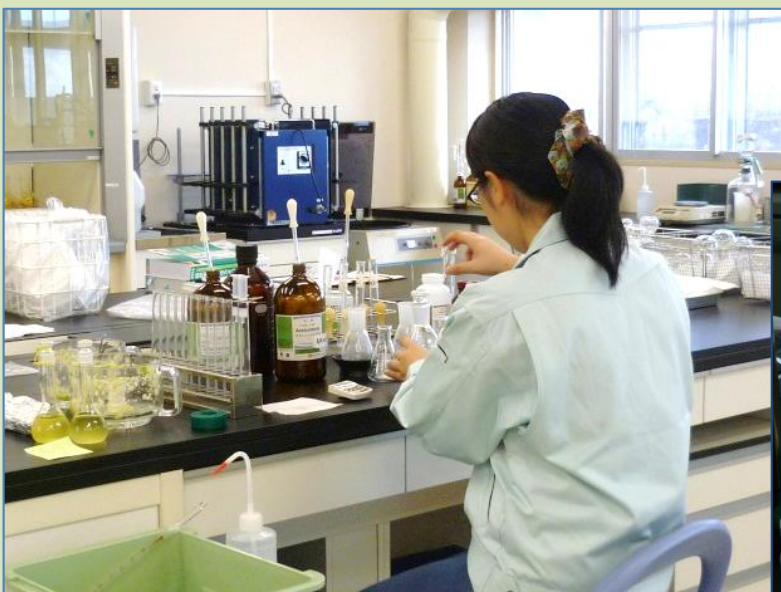
(理化学検査 残留農薬 抽出処理)