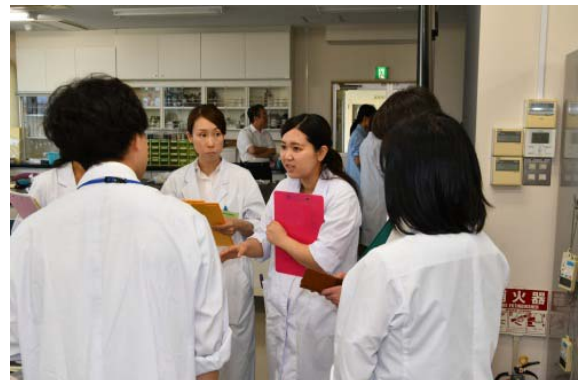
実習中の質疑応答