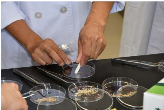
異物のタンパク検査

講習会で習得した検査技術については、調理員への衛生教育や研究発表などに有効利用していただいております。貸出し用検査機器の使い方なども実習しました。